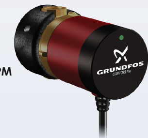
COMFORT B(S) PM BASIC