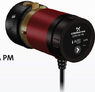
COMFORT B(X)A PM AUTOADAPT