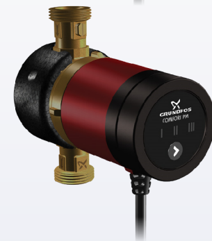
COMFORT B(X)S PM 3 TACHYTHTES